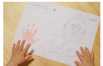
とーはくでてがたアート