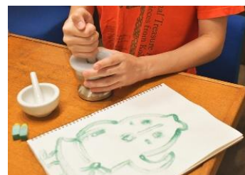
昨年度「あそびばとーはく！」のワークショップの様子