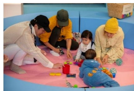
昨年度「あそびば ーはく! ーはく!」の、ベビーエリアの様子

そこで当館では、令和 6 年 7 月から 10 月にかけて、「子育て世代を対象とした来館者・非来館者調査」を実施しました。その結果、子育て世代の来館満足度に強い影響を与える要因として、「インフラ整備」、「恒常的な子ども・ファミリー向けの施策」、「低年齢層（未就学児を含む）を重点ターゲットに設定した施策」、「地域のなかの拠点としての機能」の 4 点が特に重要であることがわかりました。（調査結果の詳細は、当館ウェブサイト> シンポジウム『“未就学児”にフォーカスしたミュージアムの未来図』> 報告書（ https://www.tnm.jp/modules/r_event/index.php?controller=past_dtl&cid=1&id=11292 ）に掲載しています。）