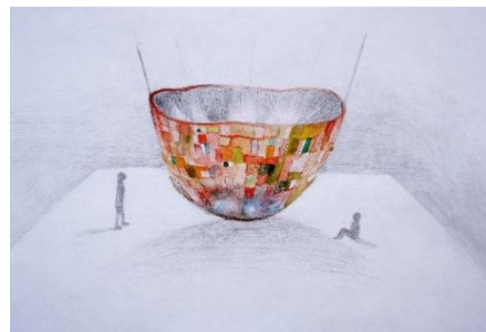
坂本夏海「袋の発明」のためのドローイング 2025 年 ©Natsumi Sakamoto, Courtesy of the Artist