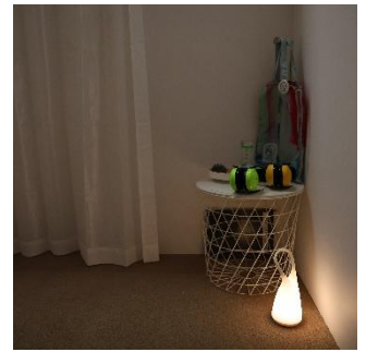
昨年度「あそびばとーはく！」の カームダウンスペースの様子

刺激から離れて、静かに気持ちを落ち着かせたいときは、カームダウンスペースをご利用いただけます。昨年度のあそびばで、当事者の方からいただいたご意見を参考に、スペースの設置位置やサイズ、出入口の扉の位置などを改良しました。