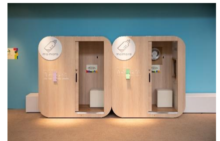
昨年度「あそびばとーはく！」の ベビーケアルームの様子