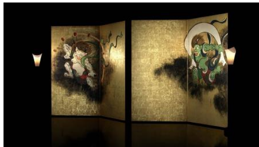
VRが可能にする蠟燭の灯による金箔の輝き再現