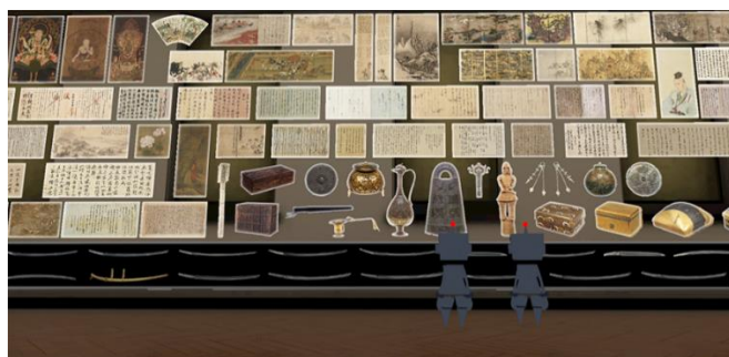
第1部「国宝を《知る》」バーチャル展示空間 開発イメージ

実物を鑑賞するだけでは体験できない作品の楽しみ方を初心者にも分かりやすく伝えます。