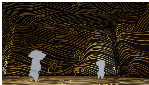
第2部「国宝に《親しむ》」国宝「八橋蒔絵螺鈿硯箱」をテーマとした展示空間 開発イメージ