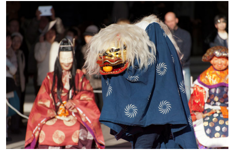
新春イベント 獅子舞 (2018 年の様子)