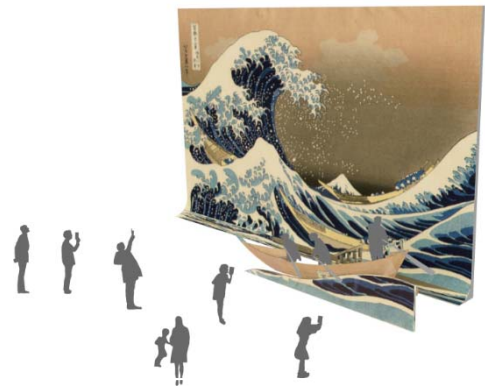
ザパーンドブーン北斎 会場イメージ