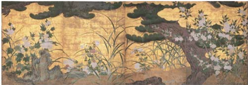
国宝「松に秋草図屏風(まつにあきくさずびょうぶ)」京都・智積院蔵