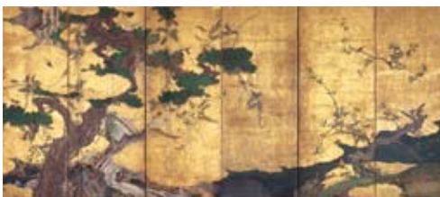
「花鳥図屏風(かちょうずびょうぶ)」