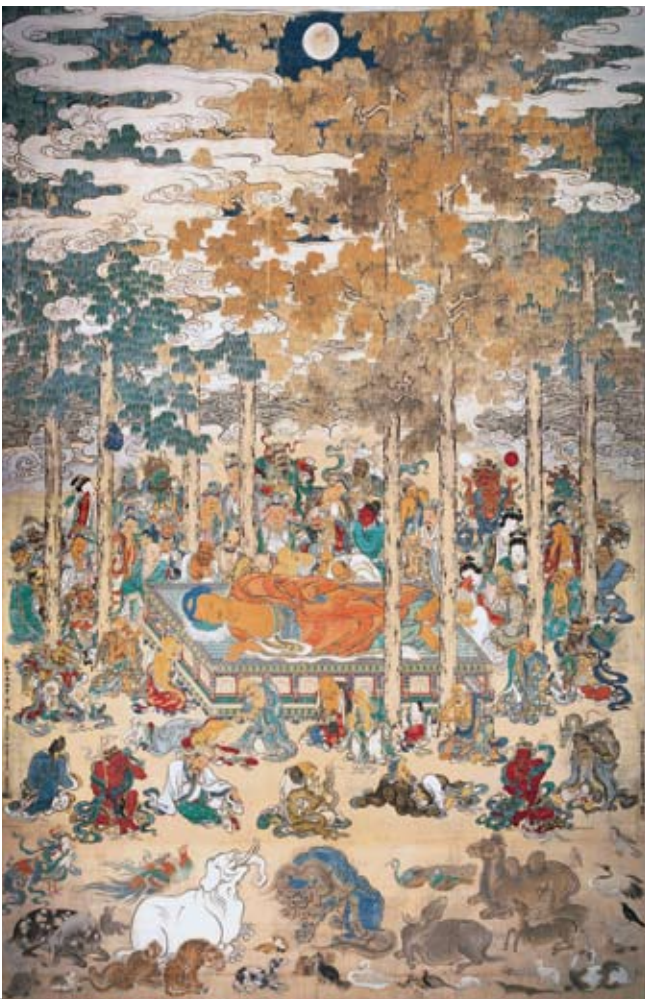
重要文化財「仏涅槃図(ぶつねはんず)」京都・本法寺蔵