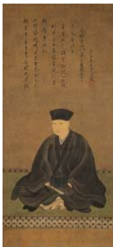
重要文化財「千利休像(せんのりきゅうぞう)」京都・表千家不審菴蔵