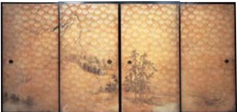
重要文化財「山水図襖(さんすいずふすま)」京都・圓徳院蔵