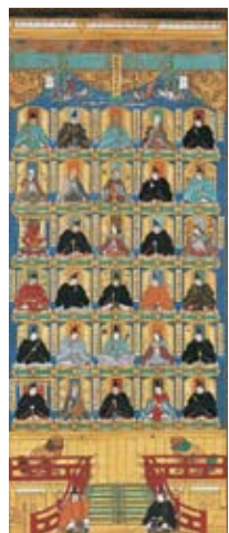
重要文化財「三十番神図(さんじゅうばんしんず)」富山・大法寺蔵