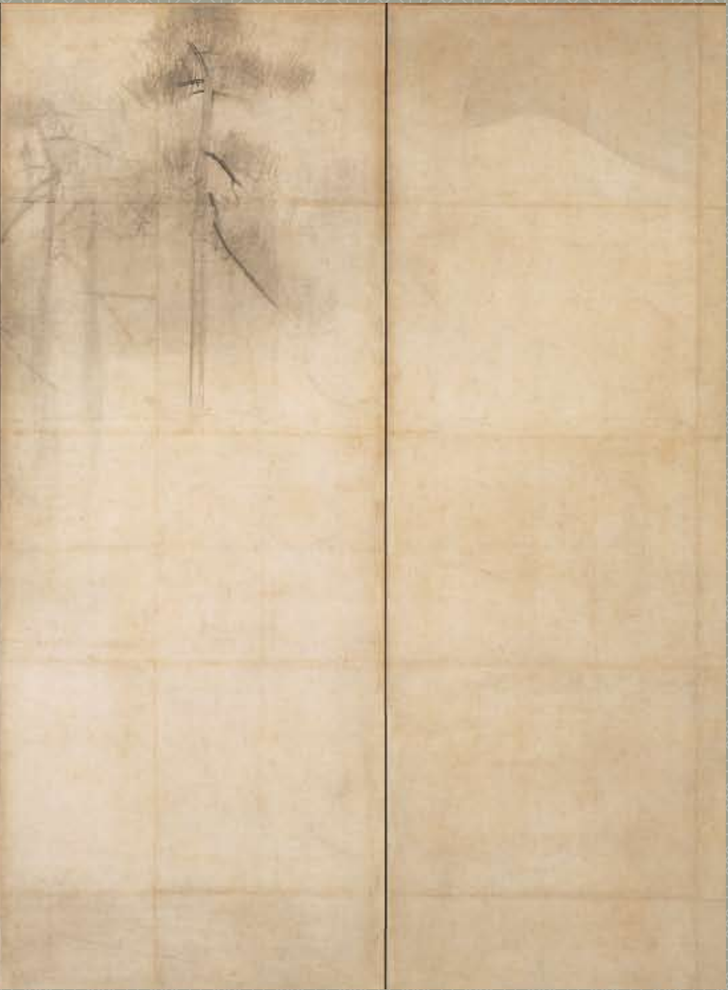
国宝「松林図屏風(しょうりんずびょうぶ)」東京国立博物館蔵(左隻)