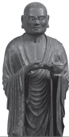
215 ◎ 富楼那立像