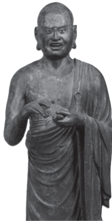
219 ◎ 羅睺羅立像