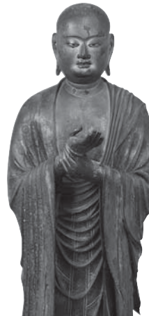
217 ◎ 阿那律立像