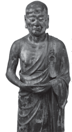
216 ◎ 迦旃延立像