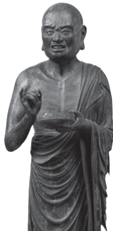
218 ◎ 優婆離立像