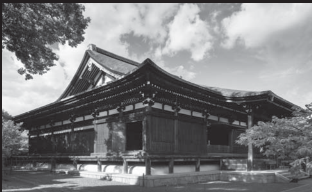
大報恩寺 本堂(国宝) 外観

本堂は、応仁の乱をはじめとする幾多の戦火を免れ、洛中最古の木造建築物として国宝に指定されています。