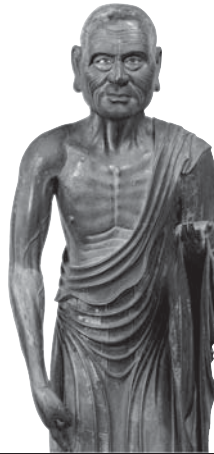
212 ◎ 目犍連立像