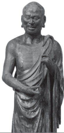
214 ◎ 須菩提立像