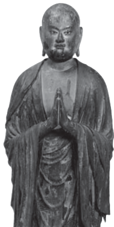
210 ◎ 阿難陀立像