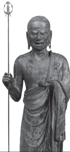
213 ◎ 大迦葉立像