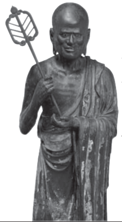
211 ◎ 舍利弗立像