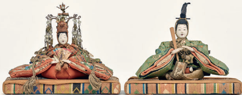
芥子雛、束帯・十二単姿

雛段の御殿には、3組の内裏雛が収められています。中央のお雛様が高級な町雛であるのに対し、両脇は装束の決まりごとに忠実な有職雛です。有職雛は宮中をはじめ、公家や大名といった上流階級で好まれました。