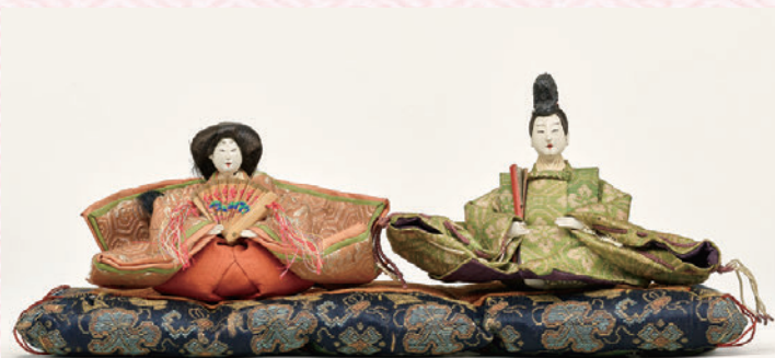
有職芥子雛、小直衣・袷姿

江戸時代・安政7年(1860) 男雛総高10.0cm、女雛総高9.0cm I-4437-1