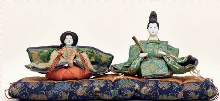
有職芥子雛、狩衣・袷姿

江戸時代・安政7年(1860) 男雛総高8.0cm、女雛高6.5cm I-4437-2