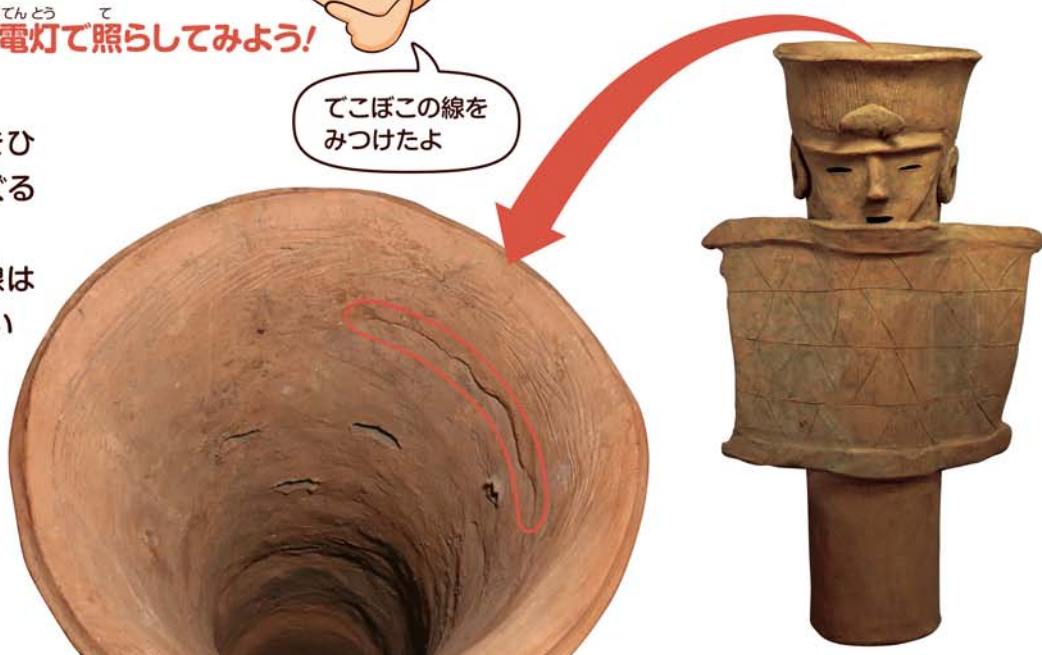
埴輪 盾持人(はにわ たてもちびと) 古墳時代(後期)・6世紀 茨城県つくば市下横場字塚原出土