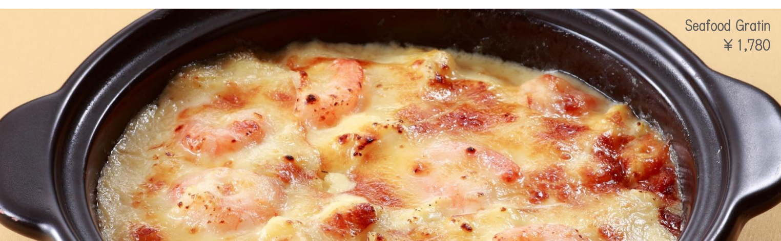
Seafood Gratin ¥ 1,780