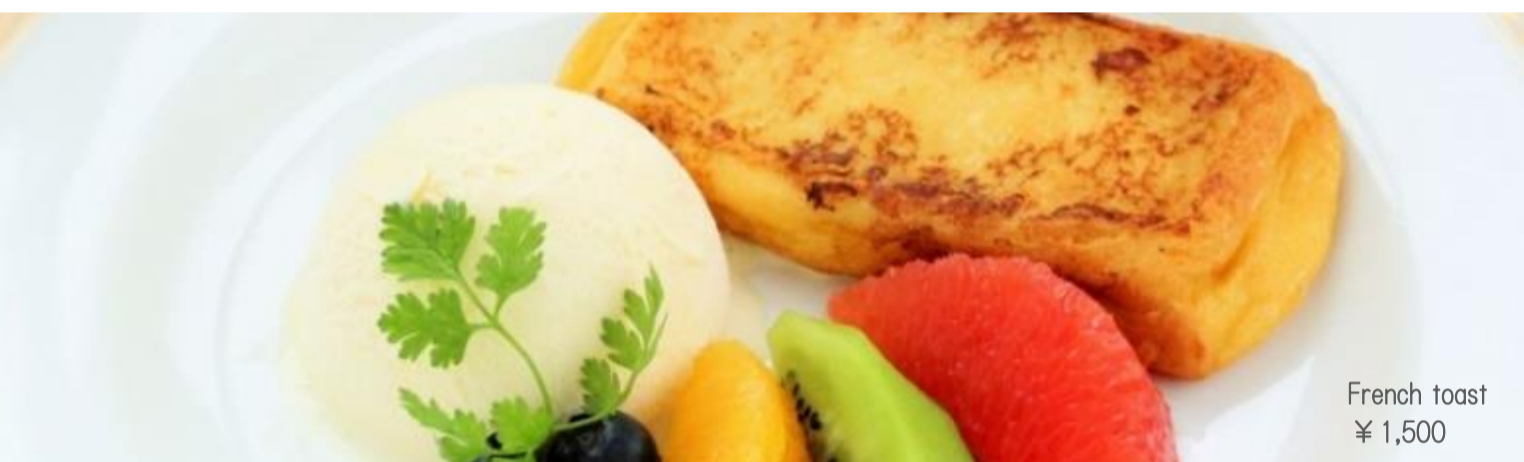
French toast ¥ 1,500