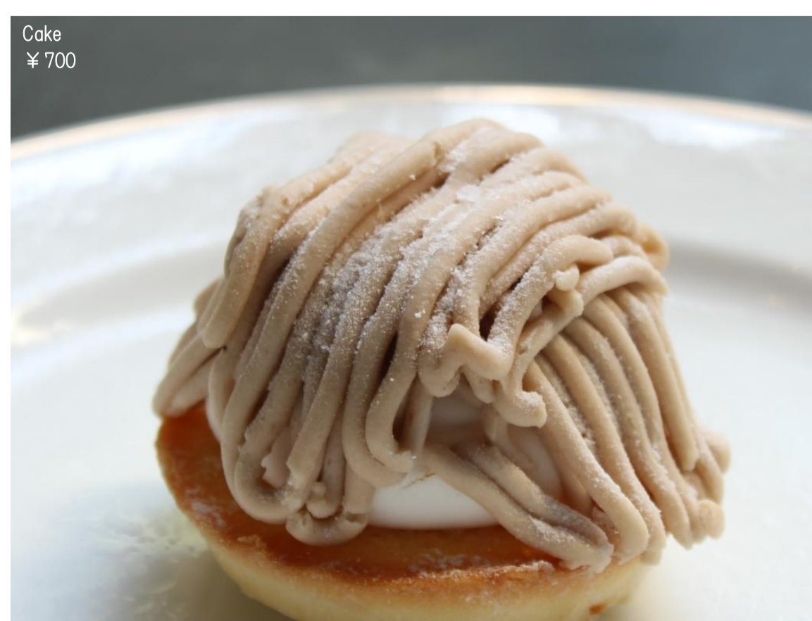
Cake ¥ 700