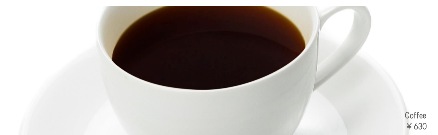
Coffee ¥ 630