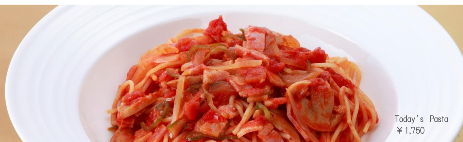
Today's Pasta ¥ 1,750