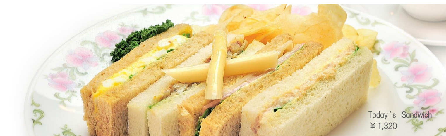
Today's Sandwich ¥ 1,320