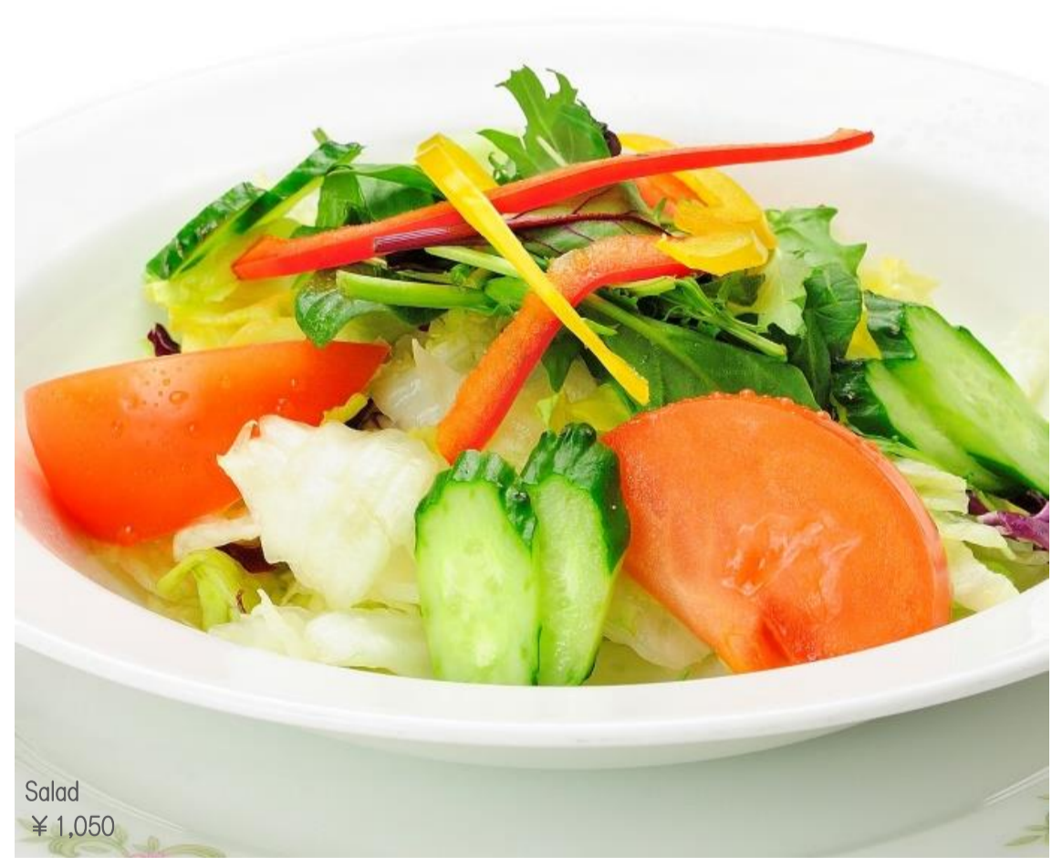
Salad ¥ 1,050