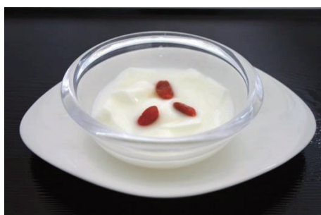
杏仁豆腐 / Almond pudding