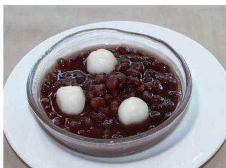
冷やし白玉ぜんざいセット