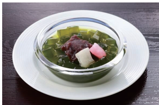
抹茶あんみつ風ゼリー