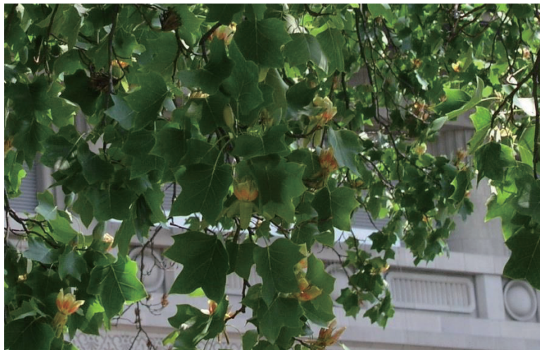
博物館正門のゆりの木。ゆりの花