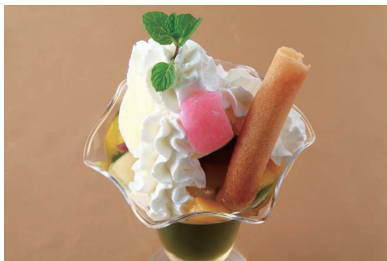
抹茶ゼリーパフェセット 1,420円 (税込1,534円) コーヒー又は紅茶付き

Green Tea Parfait with Coffee or Tea (Agar-agar Jelly Cubes, Sweet Adzuki Bean Paste, and Pieces of Fruit in Syrup)