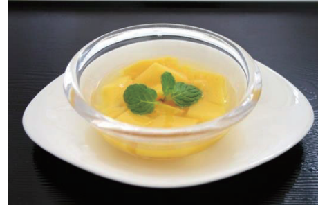
マンゴープリン / Mango pudding