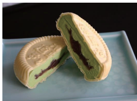
抹茶もなかアイス