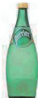
■ペリエ (330ml) Perrier