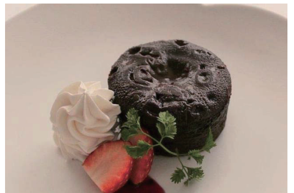
フォンダンショコラ/Chocolate Fondant 电话丹巧克力 시럽 초콜릿

食材によるアレルギーのあるお客様は予め係りにお申し出ください Kindly inform your waiter if you are allergic to certain foods or are observing dietary restrictions. 对食材过敏的顾客, 请事先告知服务员。 식재료에 의한 알레르기가 있으신 손님께서는 미리 직원에게 말씀해 주시기 바랍니다.