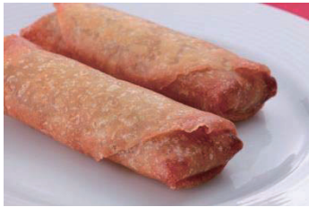
春巻き/Spring Roll 310円(税込335円) 春卷 춘권

Meal with coffee or tea plus 420 yen coffee only 570 yen.