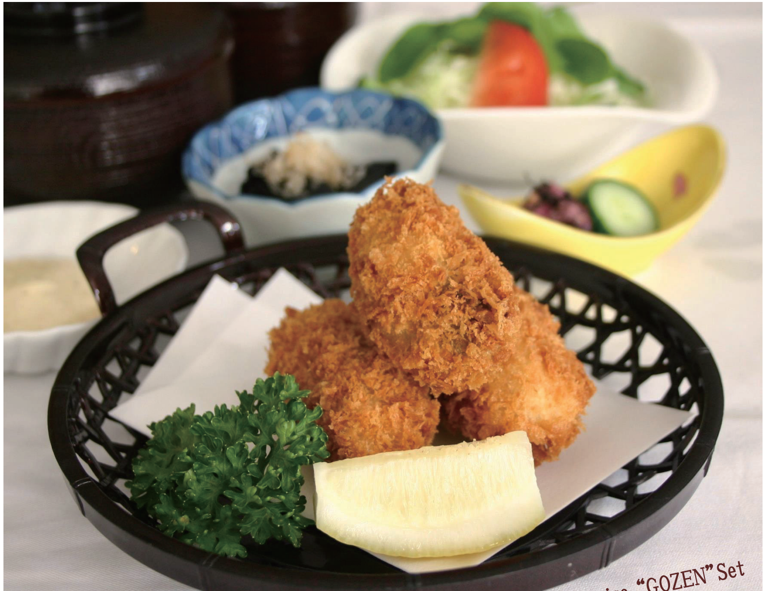
Fried Oysters "GOZEN" Set