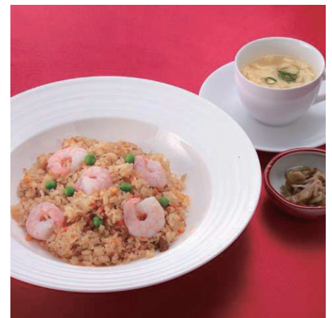
五目チャーハン/Mixed Fried Rice ・スープ・ザーサイ 870円(税込940円) 什锦炒饭 带汤和炸菜 고모쿠 볶음밥 수프·자차이 포함