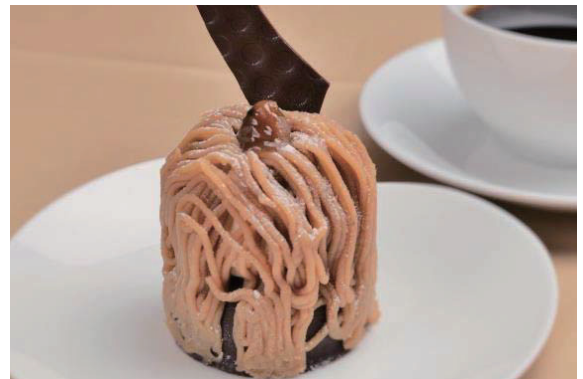
モンブラン/Mont-Blanc 栗子蛋糕 몽블랑