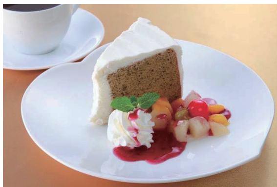
シフォンケーキ/Tea Chiffon 戚风蛋糕 시폰 케이크