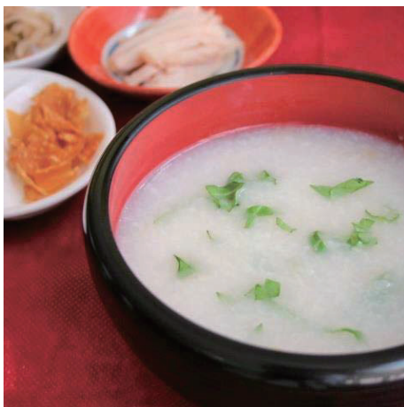
中華粥/Chinese congee ・蒸し鶏・ザーサイ 850円(税込918円) 中式稀饭 중국식 죽