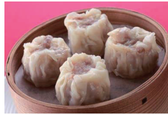
シューマイ 410円(税込443円) Steamed Pork Dry scallop Dumplings 烧卖 슈마이