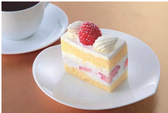
ショートケーキ/Strawberry Cake 夹心蛋糕 쇼트 케이크