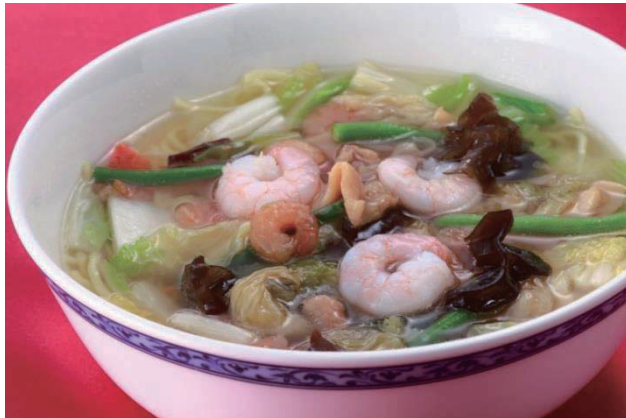
五目つゆそば/Mixed Noodle Soup 930円(税込1,004円) 什锦清汤荞麦面 고모쿠 쓰유소바