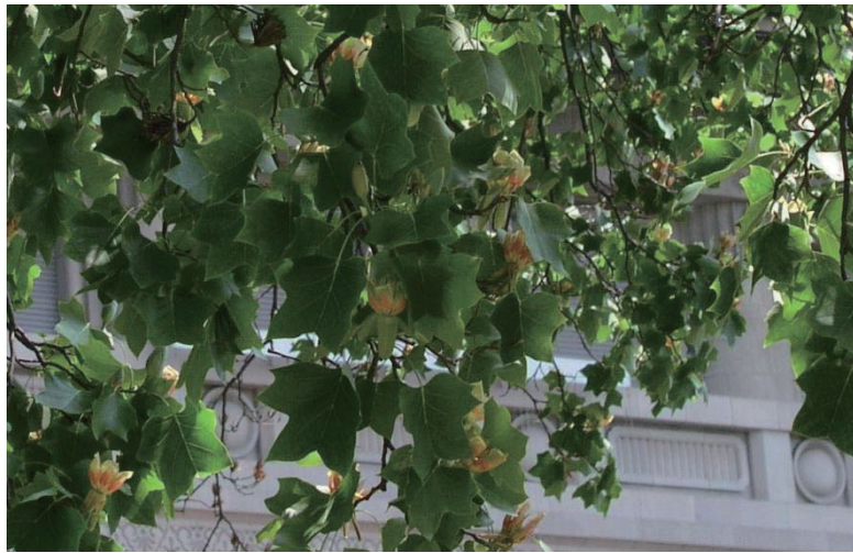
博物館正門のゆりの木。ゆりの花