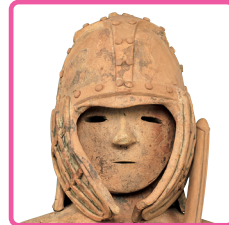
国宝 埴輪 挂甲の武人(部分) 群馬県太田市飯塚町出土 古墳時代・6世紀 東京国立博物館蔵

国宝「埴輪 挂甲の武人」には、同じ工房で製作された可能性も指摘されるほど、兄弟のようによく似たはにわが4体あります。5体勢ぞろいでの展示は史上初! ようやく巡りあえた兄弟たちの雄姿を見に来てね!