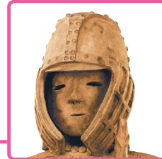
埴輪 挂甲の武人(部分) 群馬県太田市出土 古墳時代・6世紀 アメリカ・シアル美術館蔵