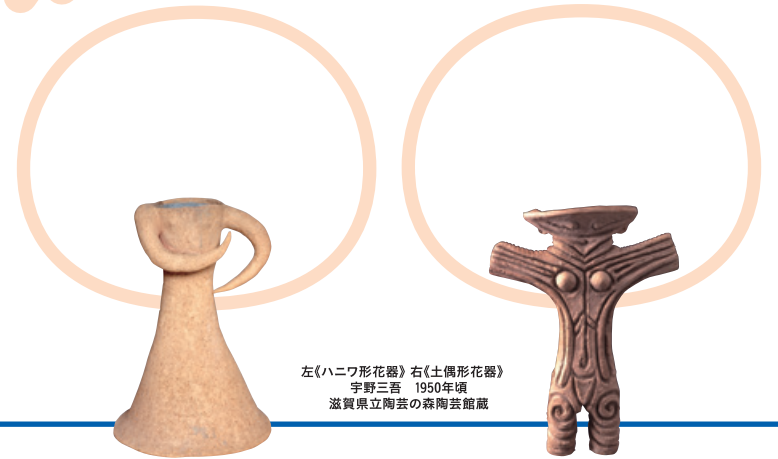
左《ハニワ形花器》右《土偶形花器》 宇野三吾 1950年頃 滋賀県立陶芸の森陶芸館蔵