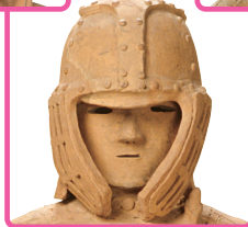
埴輪 挂甲の武人(部分) 群馬県伊勢崎市安堀町出土 古墳時代・6世紀 千葉・国立歴史民俗博物館蔵