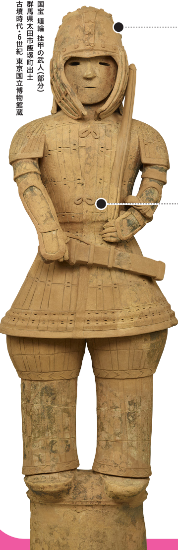
国宝 埴輪 挂甲の武人(部分) 群馬県太田市飯塚町出土 古墳時代・6世紀 東京国立博物館蔵

はにわで初めて国宝になった 東京国立博物館所蔵の 国宝「埴輪 挂甲の武人」。 頭から足まで完全武装していて、 古墳時代の武人の様子がよくわかるよ。