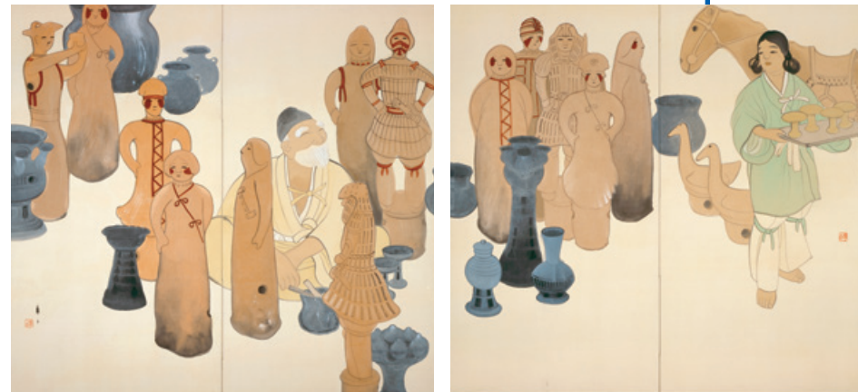
《壺輪》 都路華香 1916年 京都市立近代美術館蔵

ハニワに囲まれたおじいさんが、ニコニコ笑っています。右の人は板に何かを乗せて運んでいるようです。昔風の服を着た二人は、なにをしているのでしょうか。ここは発掘の現場でしょうか？ おじいさんの前には道具があり、板にのったものたちは焼く準備ができて窯にはこぼれているところなのでしょう。人の形のハニワがつくられたのは5～6世紀ごろのこと。およそ100年前につくられたこの作品は、はるか昔を想像して、ハニワをつくる様子をえがいたのですね。