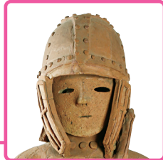
重要文化財 埴輪 挂甲の武人(部分) 群馬県太田市成瀬町出土 古墳時代・6世紀 群馬県立歴史博物館蔵