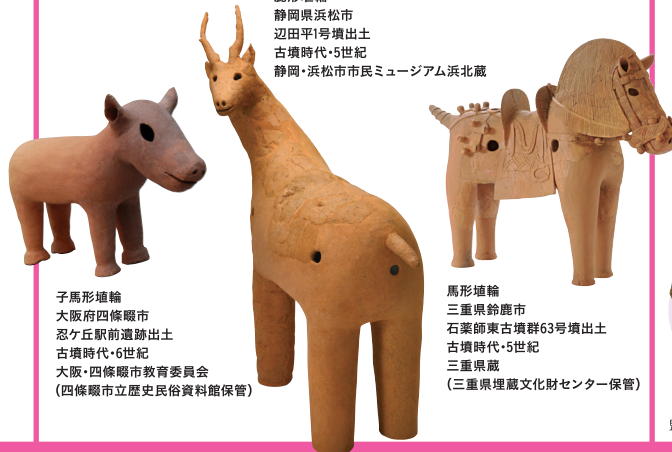
子馬形埴輪 大阪府四條畷市 忍ヶ丘駅前遺跡出土 古墳時代・6世紀 大阪・四條畷市教育委員会 (四條畷市立歴史民俗資料館保管)

古墳からは、馬、鹿、鳥、犬、猪など、実にさまざまな動物の埴輪が発見されています。また、同じ鳥でも鶏、鷹、白鳥などが作られました。