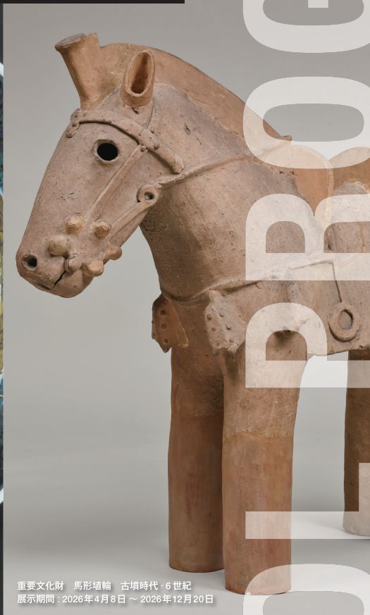
重要文化財 馬形埴輪 古墳時代・6世紀 展示期間：2026年4月8日 ~ 2026年12月20日