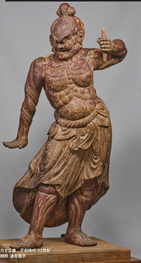
金剛力士立像 平安時代・12世紀 展示期間：通年展示