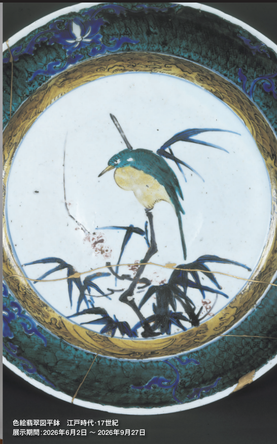
色絵翡翠園平鉢 江戸時代・17世紀 展示期間：2026年6月2日 ~ 2026年9月27日