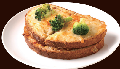
ブロッコリーとくるみのグラタンサンド BROCCOLI AND WALNUT GRATIN SANDWICH ¥820

ブロッコリーとくるみの食感が楽しい、 濃厚なボロネーゼとホワイトソースのグラタンサンド。 チーズがとろける贅沢な味わいです。