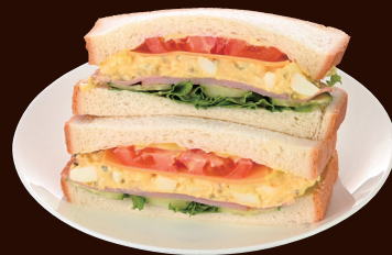
ミックスサンド MIXED SANDWICH ¥810

ブロッコリーとくるみの食感が楽しい、 濃厚なボロネーゼとホワイトソースのグラタンサンド。 チーズがとろける贅沢な味わいです。