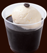
コーヒーゼリー ¥500 DOUBLE NEL DRIP COFFEE JELLY

オリジナルのミルク珈琲アイスと 自家製コーヒーゼリー。 ミルク珈琲マカロンをトッピング。