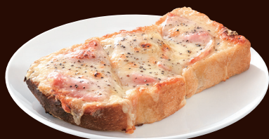
3種チーズのクロックムッシュ 3 TYPES OF CHEESE CROQUE MONSIEUR ¥660