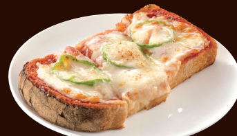
ピザトースト PIZZA TOAST ¥720