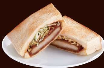
上島珈琲店のカツサンド PORK CUTLET SANDWICH ¥830