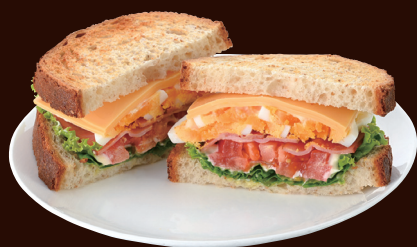
B・L・T with チーズエッグ BLT WITH CHEESE AND EGG ¥790