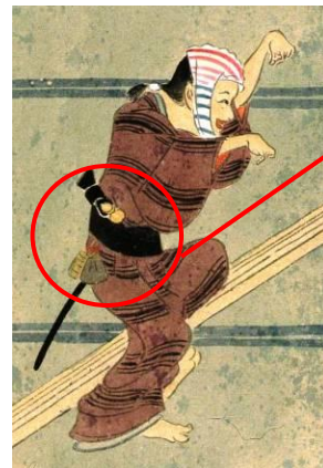
根付と提物 (印籠、巾着など)

同室では、現代根付の主だった作家や素材を網羅する殿下のコレクションから常時約50点を展示、一つ一つに斬新な創意と工夫が凝らされた、根付の魅力をお楽しみいただけます。