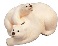
オーロラⅡ 福山恒山 1998年 マンモス牙、海松 5.2cm