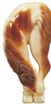
馬 グレグ・ストラディオット 1993年 セイウチ牙化石 7.3cm