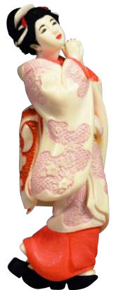
お願い 駒田柳之 1989年 象牙 7.8cm