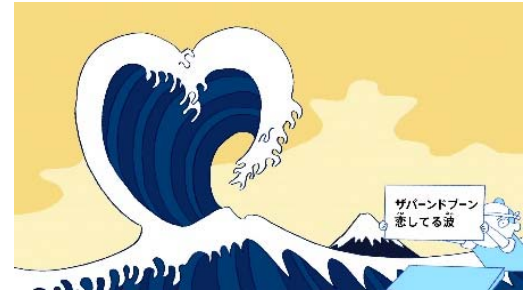
ザパーンドブーン LOVE ©NHK・井上涼 2018

高さ約 7.5 メートルの特大スクリーンに、画中の人物が原寸大になるように「富嶽三十六景・神奈川冲浪裏」を拡大映像化。絵のなかの人物になりきってみると、大きな波が大迫力で迫ってくるはず。さらに、声の大きさと波がどんどん大きくなるインタラクティブな仕掛けによって、波の大きさを実感できます。