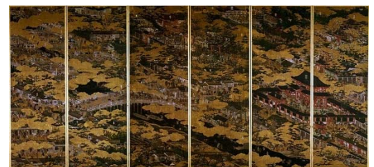
国宝 洛中洛外図 舟木本 岩佐又兵衛筆 東京国立博物館蔵