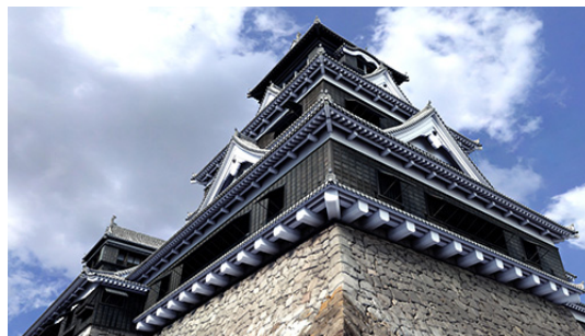
左:五重・三重の櫓が立ち並ぶ江戸時代中期の熊本城、右:防御の仕掛けで固めた天守 VR 作品『熊本城』

建築監修:平井聖(東京工業大学名誉教授)、北野隆(熊本大学名誉教授)、伊東龍一(熊本大学教授) シナリオ監修:吉丸良治(永青文庫常務理事) 製作:熊本城観光交流サービス株式会社 制作・著作:凸版印刷株式会社