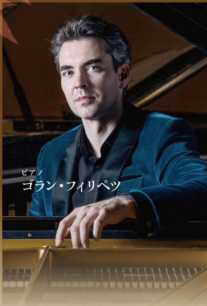
ピアノ ゴラン・フリリペツ

東京国立博物館がこの秋にお届けするのは、リスト国際ピアノコンクール優勝者でもあるピアニスト、ゴラン・フリリペツのコンサートです。豊かなテクニックに裏打ちされた音楽性に富む演奏をぜひお楽しみください！