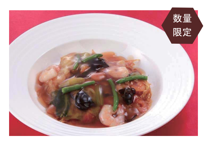
五目あんかけ焼きそば/Mixed Fried Noodles 980円(税込1.058円)