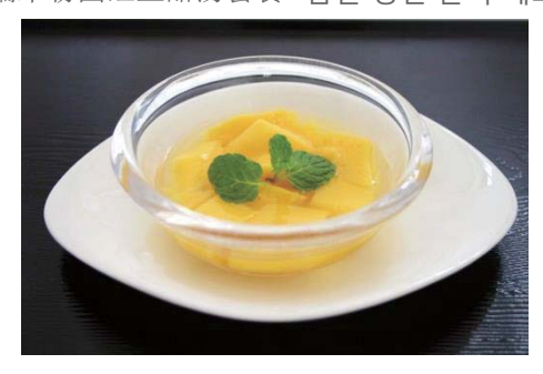
マンゴープリン/Mango pudding 390円(税込421円) 芒果布丁 망고푸딩