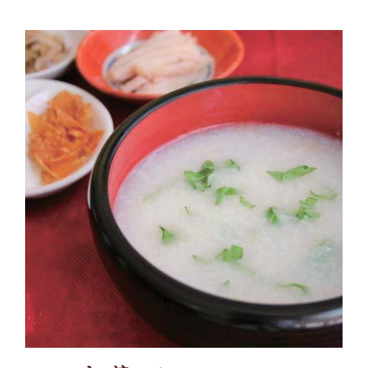
中華粥/Chinese congee ・蒸し鶏・ザーサイ 850円(税込918円) 中式稀饭 중국식 죽