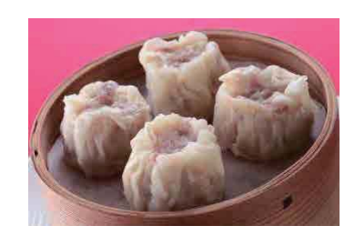
シューマイ 410円(税込443円) Steamed Pork Dry scallop Dumplings 烧卖 슈마이