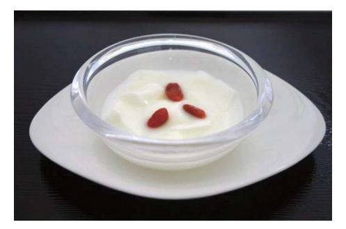
杏仁豆腐 /Almond pudding 390円(稅込421円) 杏仁豆腐 행인두부

"SHIRATAMA ZENZAI" (Sweet Red Beans Soup with a Piece of Rice-four Dumpling) 糯米粉团红豆甜汤套餐 찹쌀 경단 팥죽 세트