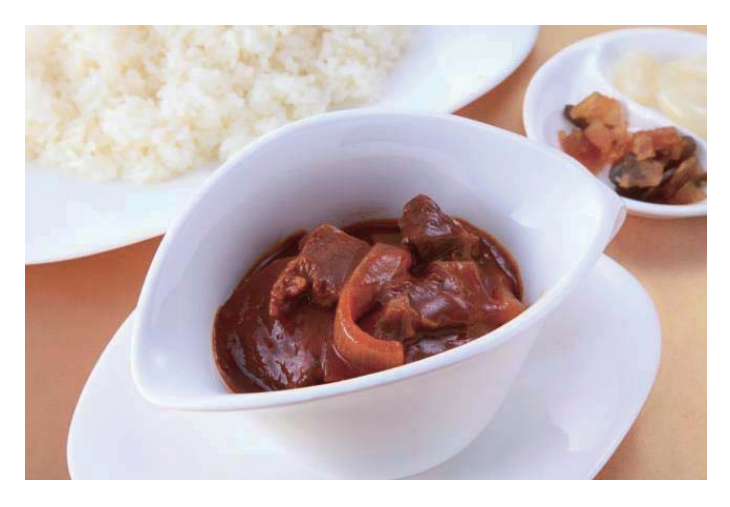
ハッシュドビーフ/Hashed Beef with Rice 1.010円(稅込1.091円)