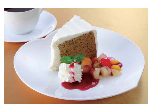
シフォンケーキ/Tea Chiffon 戚风蛋糕 시폰케이크