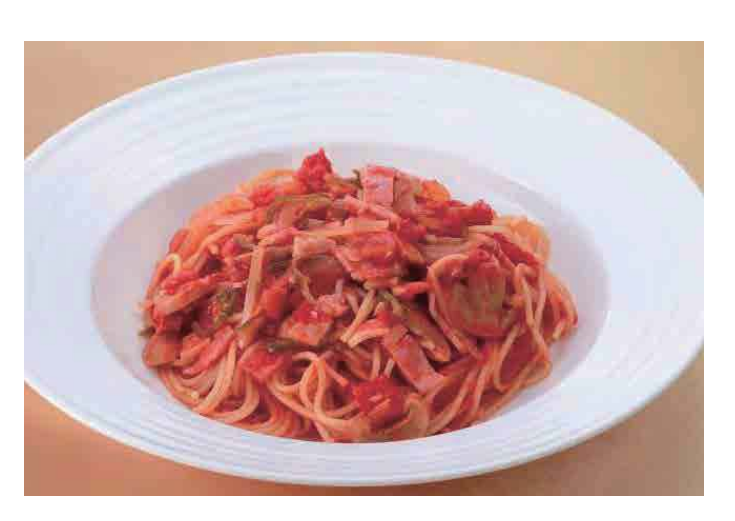
本日のパスタ/Today's Pasta 1.230円(稅込1.328円) 今日意式面食 오늘의 파스타