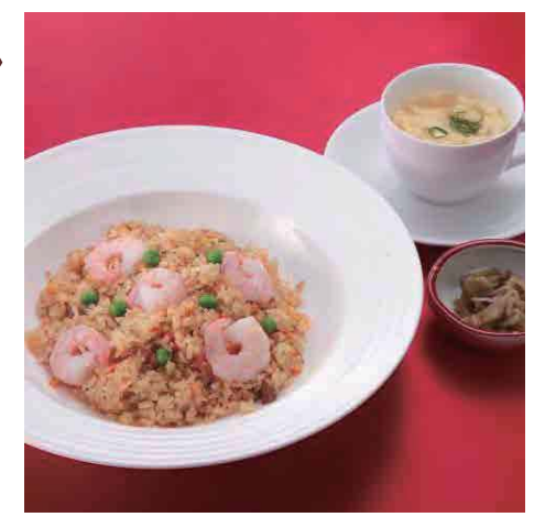
五目チャーハン /Mixed Fried Rice ・スープ・ザーサイ