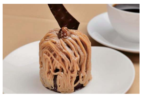
モンブラン/Mont-Blanc 栗子蛋糕 몽블랑