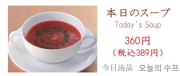
本日のスープ Today's Soup 360円 (税込389円)

Meal with coffee or tea plus 420 yen coffee only 570 yen.