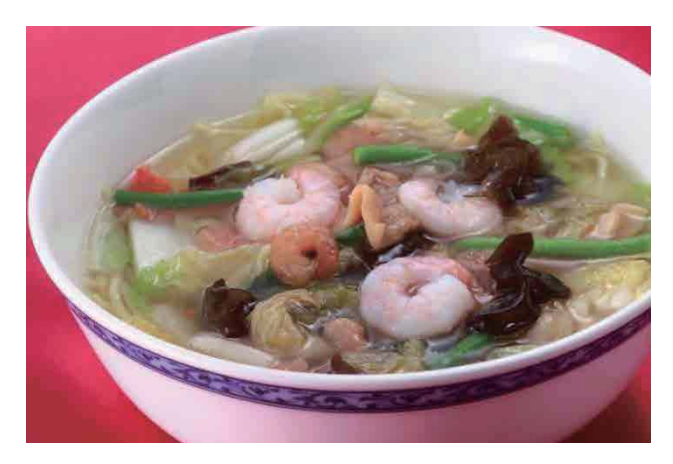
五目つゆそば /Mixed Noodle Soup 930円(税込1.004円) 什锦清汤荞麦面 고모쿠 쓰유소바