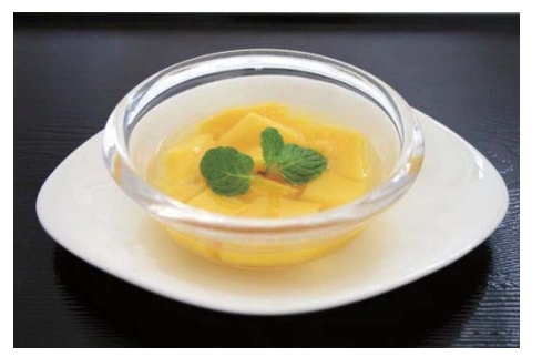
マンゴープリン/Mango pudding 390円(税込421円) 芒果布丁 망고푸딩

"SHIRATAMA ZENZAI" (Sweet Red Beans Soup with a Piece of Rice-four Dumpling) 糯米粉团红豆甜汤套餐 찹쌀 경단 팥죽 세트