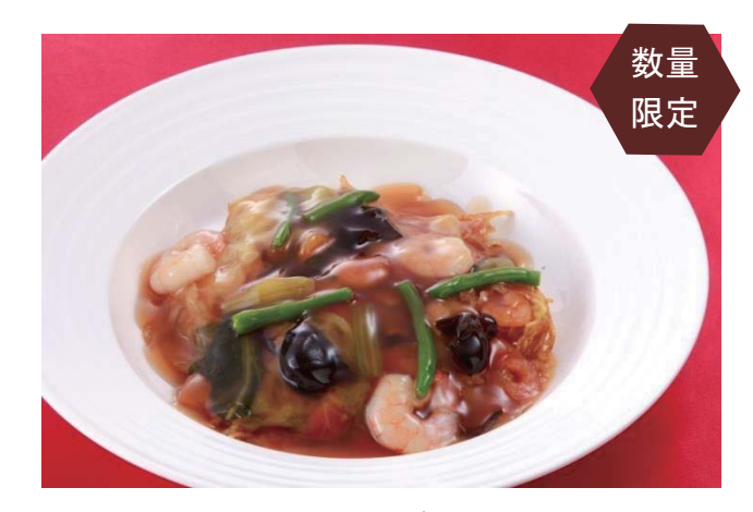
五目あんかけ焼きそば/Mixed Fried Noodles 980円(税込1.058円) 仕锦浇汁炒面 고모쿠 안카케 야키소바