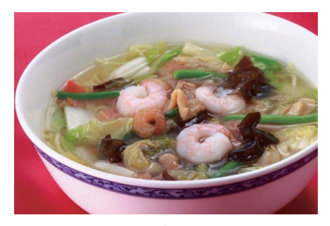
五目つゆそば /Mixed Noodle Soup 930円(税込1.004円) 什锦清汤荞麦面 고모쿠 쓰유소바