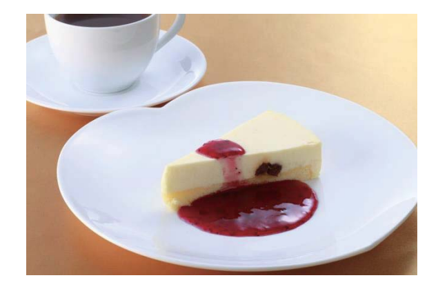
チーズケーキ/Cheese Cake 乳酪蛋糕 치즈케이크