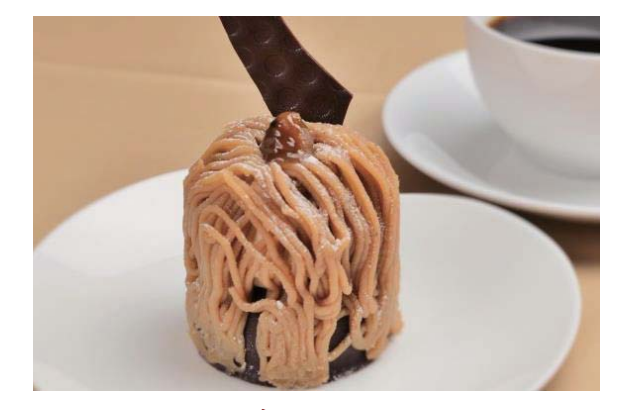
モンブラン/Mont-Blanc 栗子蛋糕 몽블랑